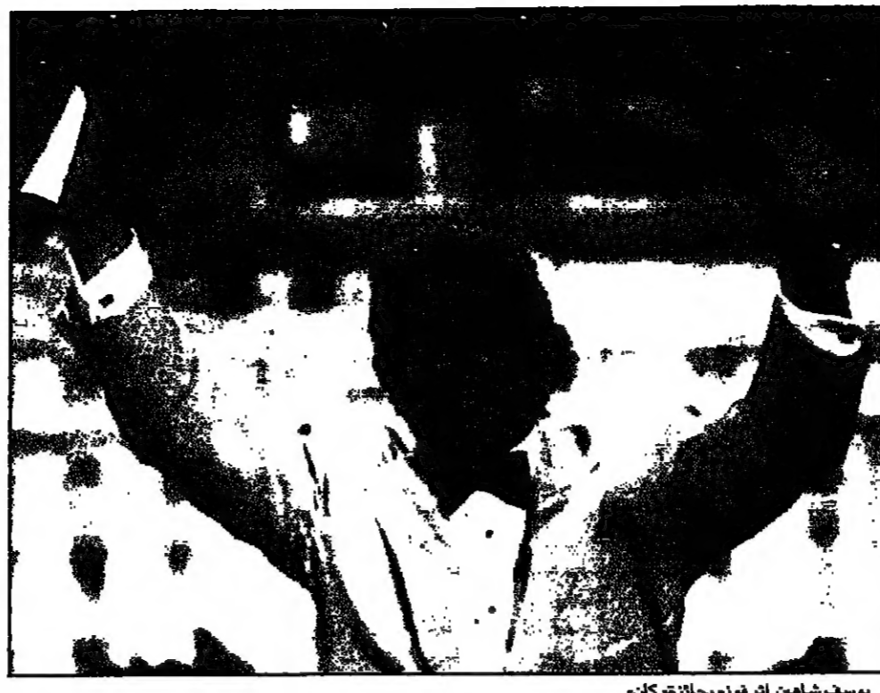
يوسف شاهين اثر فوزه بجائزة كان